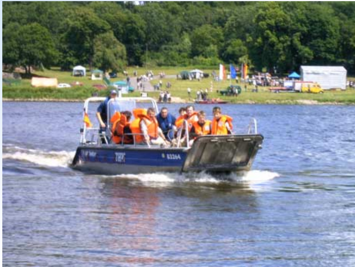
Deutsch-Polnischer Entwicklungsraum Oder/Neiße 23.Mai 2007 in Eberswalde