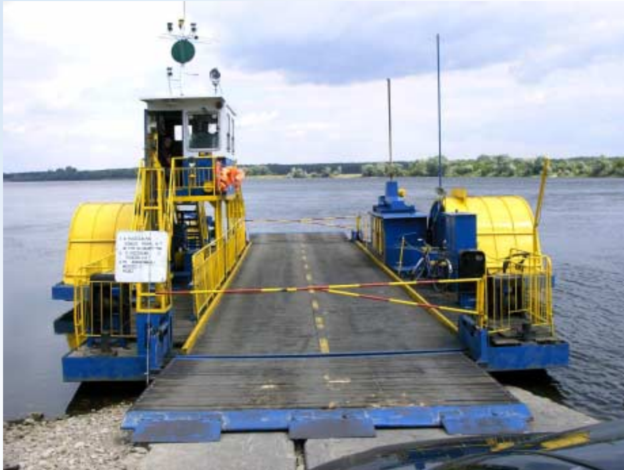
Deutsch-Polnischer Entwicklungsraum Oder/Neiße 23.Mai 2007 in Eberswalde